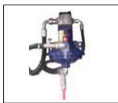
su pompası ünitesi water pump unit pompanın temizliğinde tazyikli su sağlar / it supplies pressurized water for cleaning