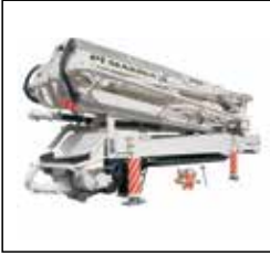
47m kamyon üstü beton pompası 47m truck mounted concrete pump üst yapı / body work