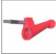
küçük pompa merkez konisi centre cone for small pump gömlerlerden gelen betonu çıkış borusuna sevk eder / it transmits concrete coming from jackets to outlet pipe