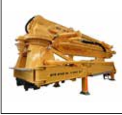
37m kamyon üstü beton pompası 37m truck mounted concrete pump üst yapı / body work