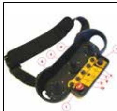
uzaktan kumanda remote control pompanın bom hareketini ve gaz sistemini kontrol eder / it controls movement of boom and engine power