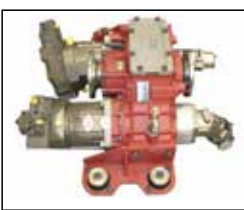
pompa tahrik dişli ünitesi power take off unit dişli kutusu şafttan gelen gücü pompalara iletir / gearbox transmits the power coming from shaft to pumps