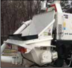
beton sevk manuel kumanda ünitesi concrete pouring manual unit hazne ve manuel kontrol ünitesi / hopper and manual control unit