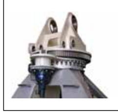
kule dönüş ünitesi tower rotation unit üst kule ve rulmandan oluşur / it consist of head and slewing bearing