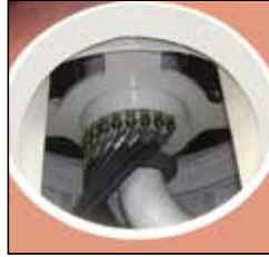
bom hidrolik dağıtıcı ünite hydraulic distributor unit kulenin sonsuz dönüşünü sağlayan ünedir / this unit gives endless rotation to tower